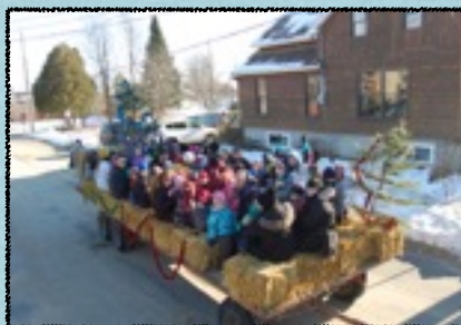
Noël des enfants 2013